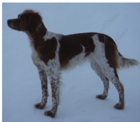
Bronsejegeren : B Geilanes Ixi NO52053/14 Eier: Eigil Haug